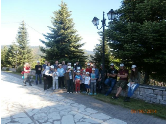
Μαθητές και φοιτητές