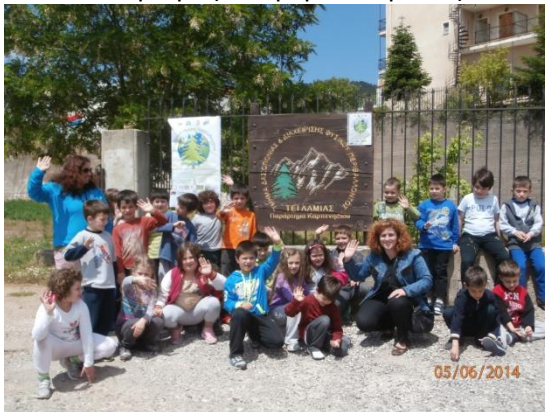
Επίσκεψη Α τάξης 1 ου Δημ. Καρπεν. στο Τ.Ε.Ι. Παρασκευή 6 Ιουνίου 2014