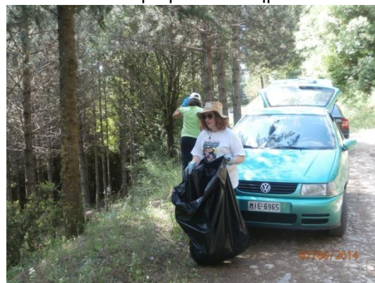
Δράσεις στο λόφο Αγ. Δημητρίου 7/6/2014