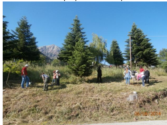
Φυτεύσεις στον Ξηριά