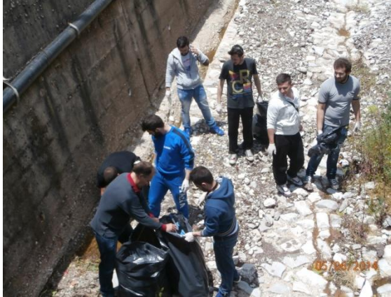
Καθαρισμός στο ρέμα Κλαρωτός