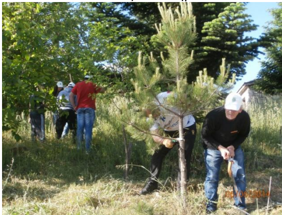
Κλαδεύσεις στον Ξηριά