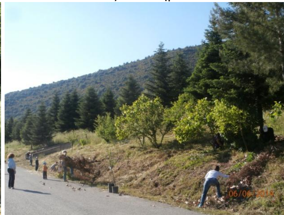
Καθαρισμοί στον Ξηριά