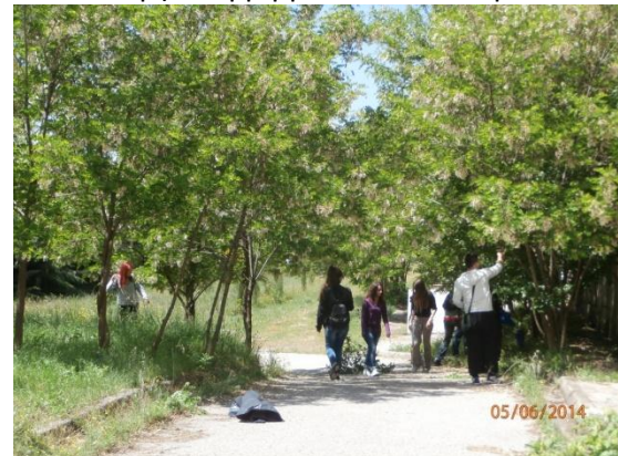
Φοιτητές κλαδεύουν το πράσινο στο ΤΕΙ