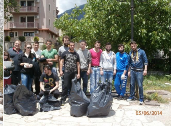
Συλλογή απορριμμάτων από Κλαρωτό