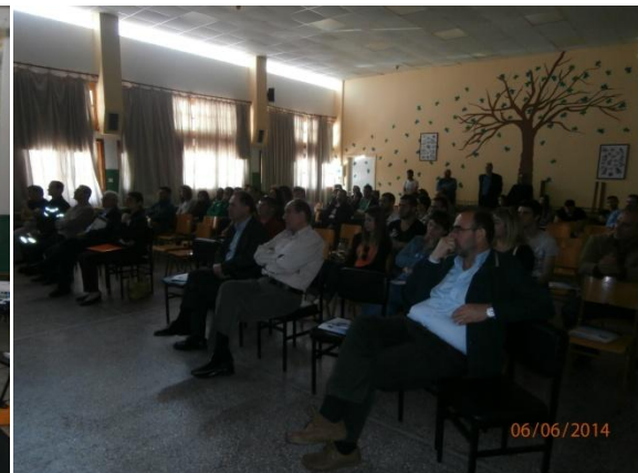
Ημερίδα & συζήτηση