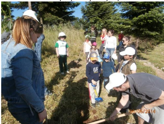
Φυτεύσεις στον Ξηριά