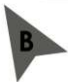
ΕΝΔΕΙΚΤΙΚΗ ΚΑΤΟΨΗ ΧΩΡΟΥ