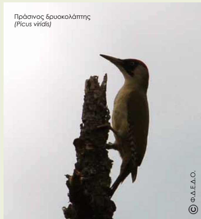
Πράσινος δρυκολάπτης ( Picus viridis )