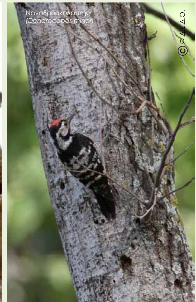
Νανοδρυκολάπτης ( Dendrocopos minor )