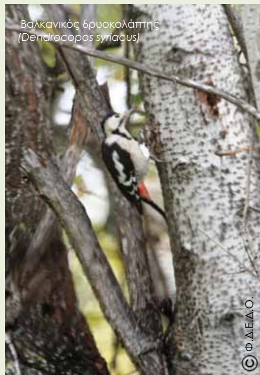
Βαλκανικός δρυκολάπτης ( Dendrocopos syriacus )

Μέχρι στιγμής στην Οίτη έχουν καταγραφεί τουλάχιστον 7 από τα 10 είδη δρυκολαπτών που φωλιάζουν στην Ευρώπη και συγκεκριμένα τα εξής: ο Μαύρος Δρυκολάπτης ( Dryocorps major ), ο Πράσινος Δρυκολάπτης ( Picus viridis ), ο Σταχτής Δρυκολάπτης ( Picus canus ), ο Βαλκανικός Δρυκολάπτης ( Dendrocopos syriacus ), ο Μεσαίος Δρυκολάπτης ( Dendrocopos medius ), ο Λευκονώτης Δρυκολάπτης ( Dendrocopos leucotos ), ο Νανοδρυκολάπτης ( Dendrocopos minor ). Αξίζει να αναφερθεί ότι ο Σταχτής, μαζί με το Λευκονώτη Δρυκολάπτη κατατάσσονται στα Σχεδόν Απειλούμενα (Near Threatened) είδη δρυκολάπτη, σύμφωνα με το Κόκκινο Βιβλίο των Απειλούμενων Ζώων της Ελλάδας (2009).