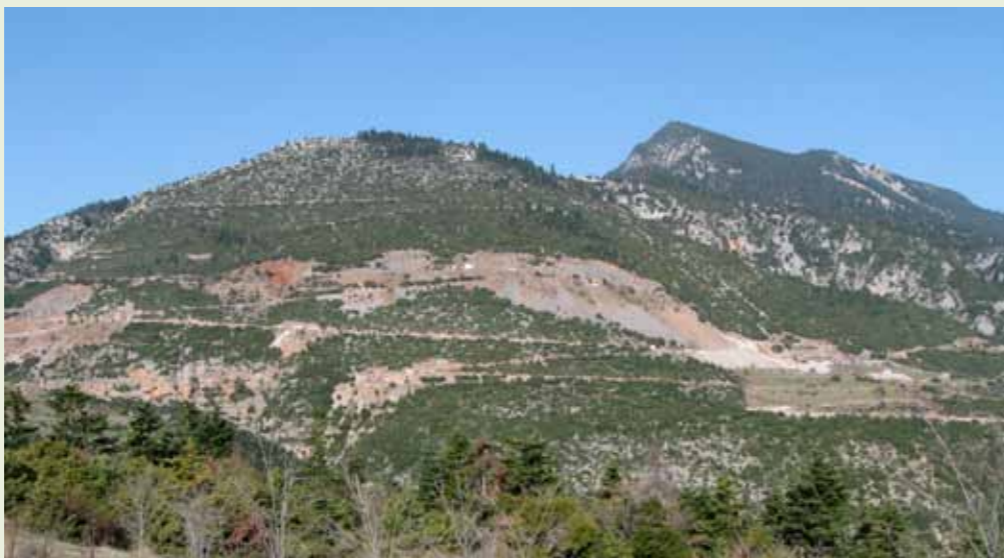
Εξορυκτικές δραστηριότητες στα Δυο Βουνά της Οίτης

Οι Φορείς Διαχείρισης των Προστατευόμενων Περιοχών, σκοπός των οποίων είναι η προστασία και διαχείριση των περιοχών ευθύνης τους, βάσει της ισχύουσας νομοθεσίας (Ν. 2742/1999), είναι αρμόδιοι, μεταξύ άλλων, και για την παροχή αιτιολογημένων γνωμοδοτήσεων, πριν από την έγκριση των περιβαλλοντικών όρων, για έργα-δραστηριότητες που εμπίπτουν στις περιοχές ευθύνης τους, καθώς και για κάθε άλλο θέμα για το οποίο ζητείται η γνώμη τους από τις αρμόδιες αρχές. Συγκεκριμένα, ο Φορέας Διαχείρισης Εθνικού Δρυμού Οίτης έχει ως αντικείμενο την προστασία και διαχείριση της περιοχής του όρους Οίτη, τα όρια της οποίας έχουν καθοριστεί σύμφωνα με τον Ν. 3044/2002. Στα πλαίσια των αρμοδιοτήτων του, λοιπόν, έχει γνωμοδοτήσει κατά καιρούς για διάφορα έργα στο βουνό της Οίτης που έχουν να κάνουν κυρίως με την ανάδειξη μονοπατιών, τις εξορυκτικές-μεταλλευτικές δραστηριότητες, αλλά και για Σχέδια Χωρικής & Οικιστικής Οργάνωσης Ανοικτής Πόλης (ΣΧΟΟΑΠ) περιοχών, όπως π.χ. των πρώην Δήμων Υπάτης και Γοργοποτάμου, καθώς και για την αξιολόγηση-αναθεώρηση του Περιφερειακού Πλαισίου Χωροταξικού Σχεδιασμού & Αειφόρου Ανάπτυξης Περιφέρειας Στερεάς Ελλάδας.