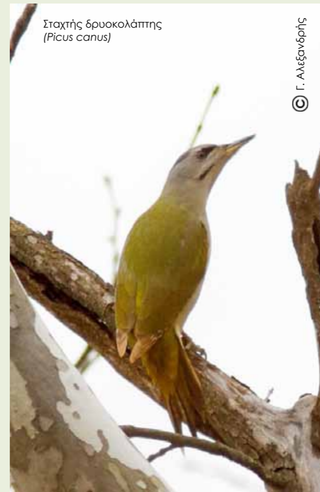
Σταχτής δρυκολάπτης ( Picus canus )